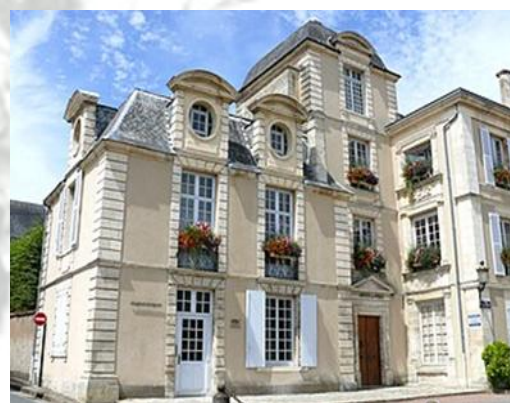
L'hôtel de ville, dit Hôtel de Pied-Foulard