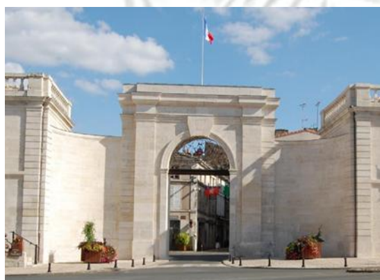
La Porte Châlon